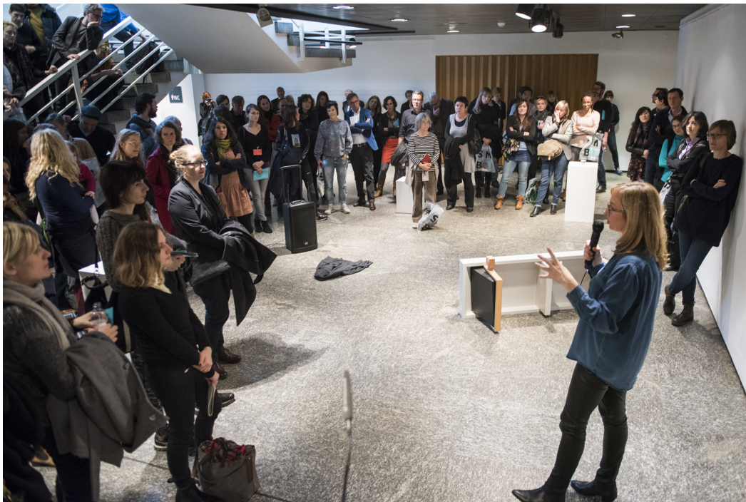
„The Exhibition“, Vortrag und Vorführung von Dorothea von Hantelmann, Foto: Sebastian Bolesch