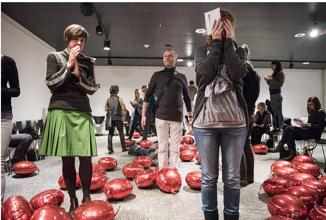
„Ins Tanzen“, Choreografie von deufert&plischke, Foto: Sebastian Bolesch