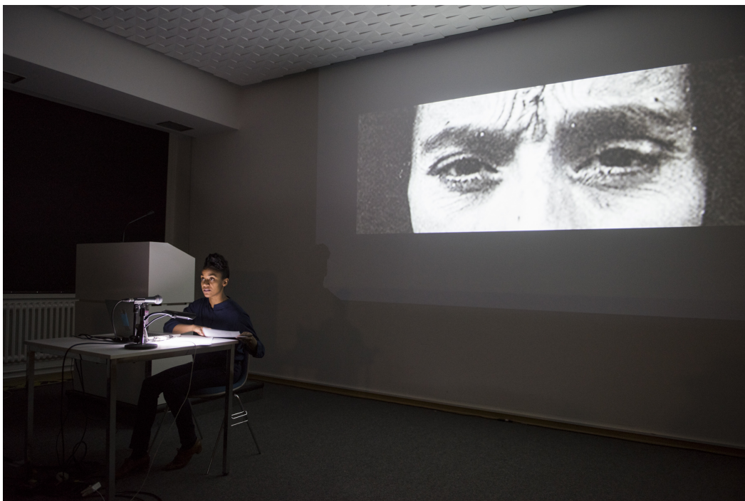
„Museum for the Blind“, Lecture Performance von Kapwani Kiwanga